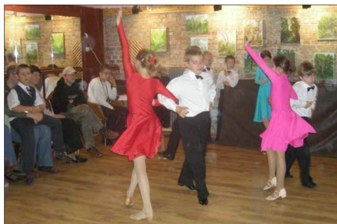
Turniej Tańca „O złoty jesienny liść”