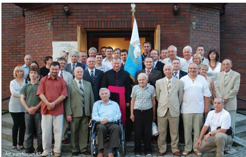
fol. z archiwum KS Borek