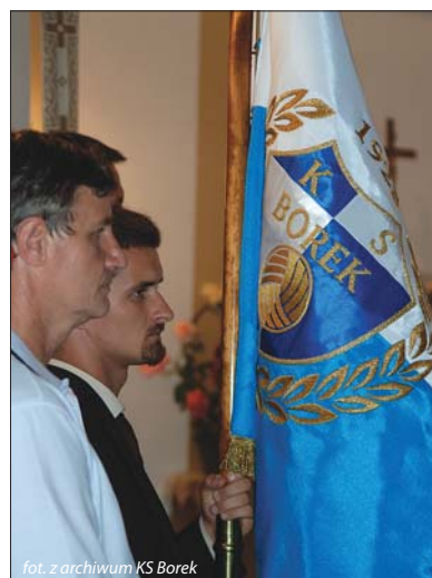
fol. z archiwum KS Borek