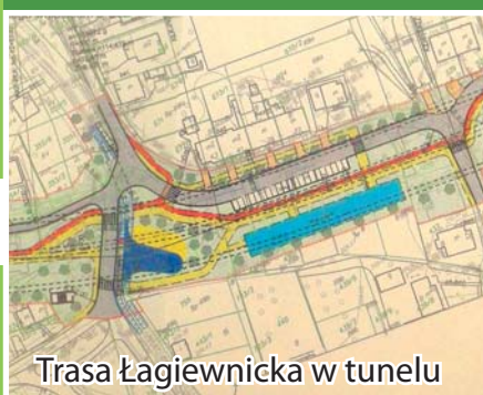
Trasa Łagiewnicka w tunelu