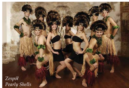
Zespół Pearly Shells

wywodzące się z Hawajów, z Tahiti, z Wysp Cooke’a oraz z Nowej Zelandii. Taniec hawajski hula inspirowany jest poprzez świat fauny i flory, ten taniec to zazwyczaj opowieść o otaczającej nas przyrodzie. Tańce tahitańskie są bardziej żywiołowe, główną rolę odgrywają tutaj bębny, co przekłada się na efektowne układy taneczne.