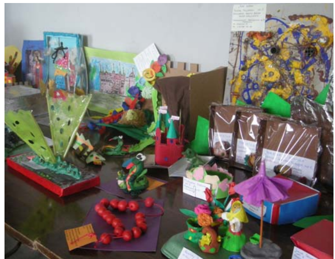
Wystawa prac w holu w Centrum Sztuki Współczesnej Solvay