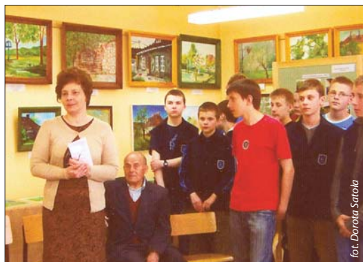
Wernisaż wystawy poplenerowej, maj 2008

Od 2003 r. miejscowi oraz inni zaproszeni artyści spotykają się na organizowanych przez ŁTK plenerach malarskich (finansowanych z pomocą Rady Dzielnicy IX) uwieczniających obraz dzisiejszych Łagiewnik – stare Łagiewniki, zespół pałacowo-dworski, zabudowę Sanktuarium Bożego Miłosierdzia. Jeden z plenerów nosił tytuł „Łagiewnickie pejzaże”. Część z około 200 prac, które dotychczas powstały, tworzy galerię w Sali nr 22 w ZSO Nr 17 przy ul. Fredry.