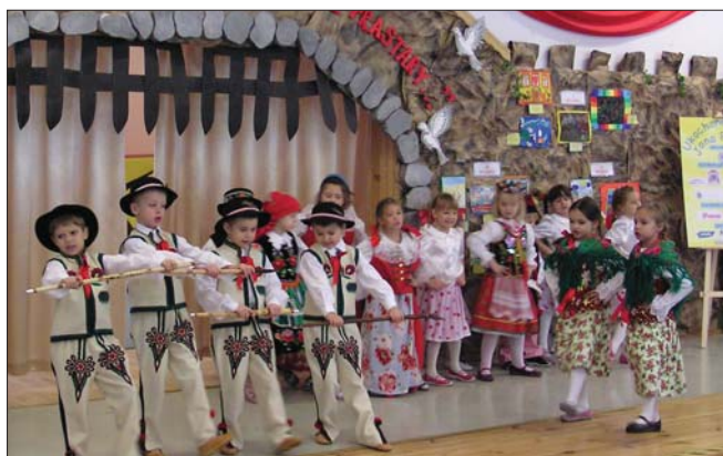
Występ dzieci w czasie uroczystości wręczenia nagród laureatom konkursu

stęp starszaków z grup I i X. Spotkanie przebiegało w miłej i radosnej atmosferze. Dzieci miały możliwość pokazania swojej pracy wyeksponowanej na wystawie pokonkursowej oraz wypowiedzenia się na jej temat. Wszyscy autorzy prac zostali docenieni poprzez wspaniałe nagrody i duże owacje.