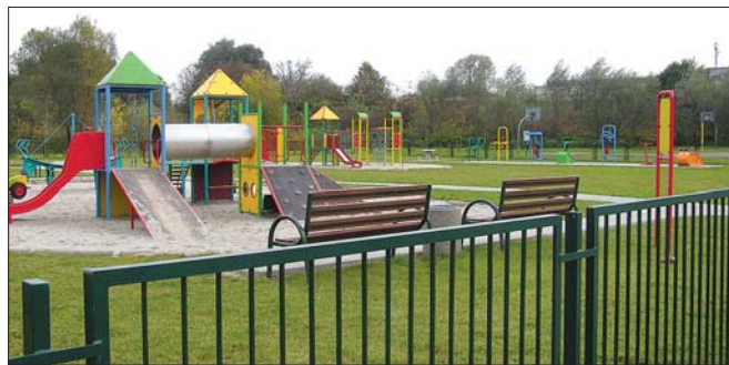
Nowy ogródek jordanowski przy ul. Fredry, wybudowany w 2010 r.

Środki przydzielone przez Radę Dzielnicy IX do dyspozycji bibliotekom umożliwiły zorganizowanie spotkań autorskich z pisarzami oraz warsztatów teatralnych dla dzieci i młodzieży z okolicznych placówek w Filii Nr 10 Biblioteki Podgórskiej przy ul. Żywieckiej. Dzięki wsparciu Rady Dzielnicy IX Filia Nr 20 przy ul. Borsuczej, rozbudowana w 2005 r., wyposażona została w nowe meble i komputery ze stałym dostępem do Internetu. Księgozbiory obu bibliotek regularnie uzupełniane są o nowości wydawnicze.