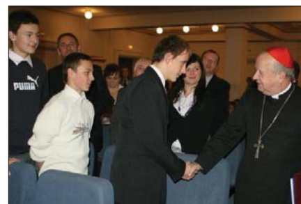
Gratulacje od ks. Stanisława kard. Dziwisza

Dzieci niesłyszące poprzez twórczość kompensują niepełnosprawność. A uznanie ich szczególnych talentów pomaga im wierzyć w siebie, i postrzegać siebie jako wartościowych ludzi.