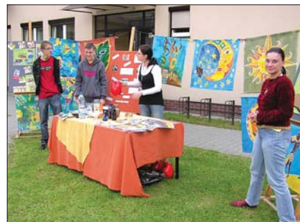
Kiermasz z kawiarenką podczas Dni Dzielnicy IX