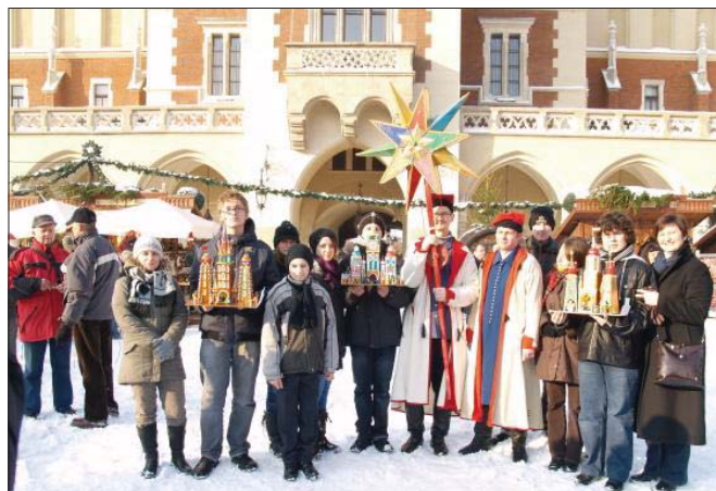
Uczniowie SOSW Nr 6 z ul. Niecałej ze swoimi arcydziełami na Rynku Głównym

Szopki są przynoszone przez przedszkolaków, uczniów, studentów, reprezentantów najróżniejszych zawodów, pensjonariuszy domów opieki i emerytów.