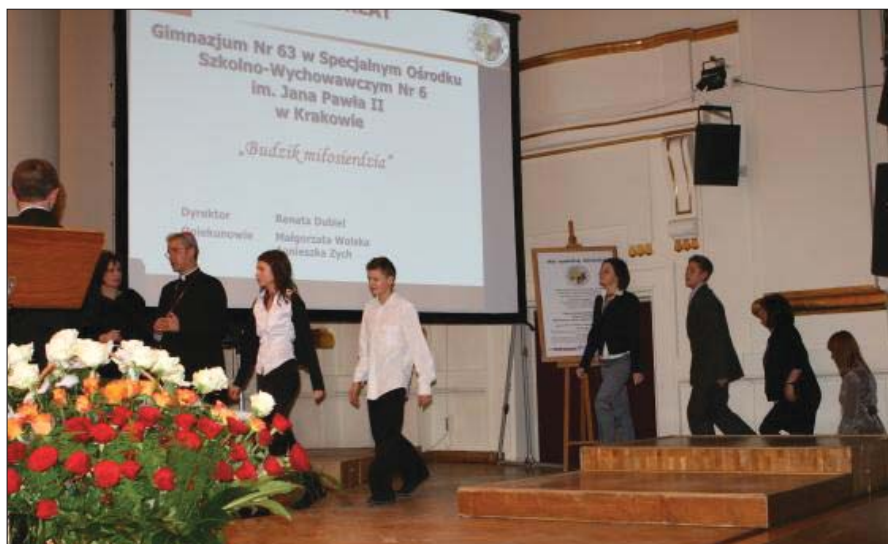
Gala finałowa tegorocznej edycji „Mieć wyobraźnię miłosierdzia”, wychowankowie SOSW Nr 6 odbierają dyplom laureata, Filharmonia Krakowska, 2 XII 2010 r.

„Budzik miłosierdzia” był owocem współpracy uczniów z Salezjańskim Ośrodkiem Misyjnym, ze studentami Uniwersytetu Pedagogicznego oraz z Radą Dzielnicy IX. Fundusze zebrane przez młodzież w ciągu kilku miesięcy działalności przekazane zostały do Salezjańskie-