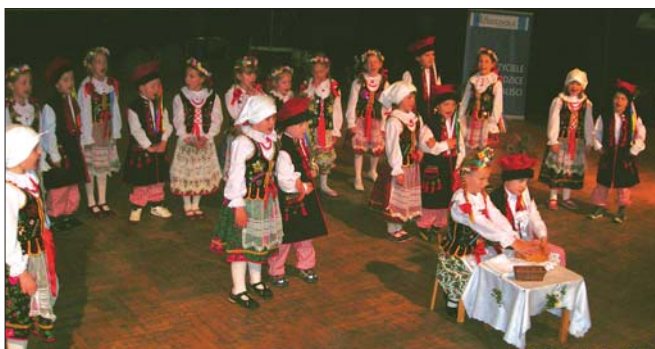
Obrzęd wesela krakowskiego przygotowany przez dzieci z Przedszkola Nr 95 – inscenizacja wyróżniona na III Przeglądzie „Tańczę i śpiewam w Krakowie”