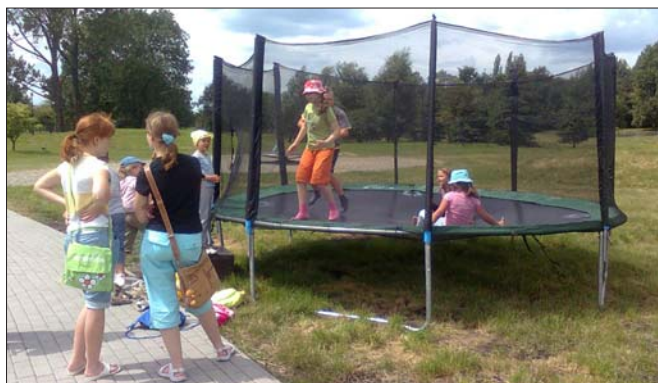
W Parku Doświadczeń z dziećmi uczestniczącymi w zajęciach w CSW Solvay

Był to czas wspólnych gier świetlicowych, rozwiązywania quizów i łamigłówek oraz zabaw sprawnościowych w plenerze. CSW „Solvay” odbywały się warsztaty plastyczne, tworzenia biżuterii oraz filcowania, w Klubie Iskierka kurs rysowania i malowania z natury. Dzieci spędzające czas w CSW „Solvay” miały okazję na wspólne wyście do kina na