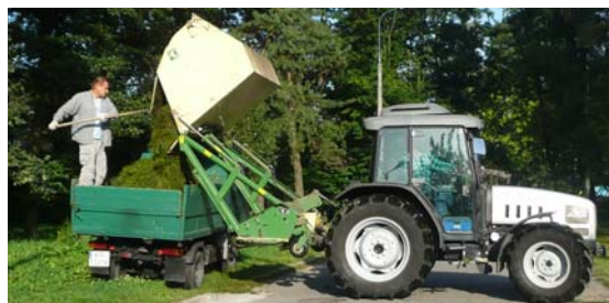
W ramach finansowania przez Radę Dzielnicy IX utrzymania zieleńców i skwerów uporządkowano teren Parku Solvay.