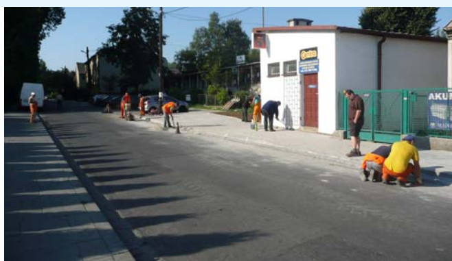
We wrześniu oddano do użytku zmodernizowaną ulicę Dekarzy oraz wyremontowany chodnik przy ulicy Niemcewicza.