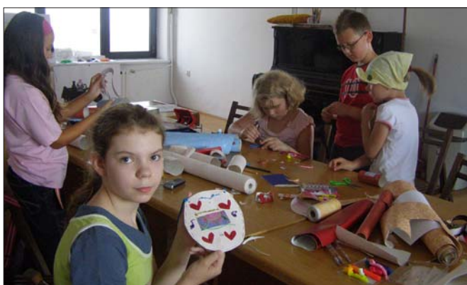
Zajęcia plastyczne w Centrum Sztuki Współczesnej Solvay

filmy: „Epoka lodowcowa 3”, „Noc W Muzeum 2”, „Potwory kontra obcy”, „Hannah Montana” oraz „Załoga G”.