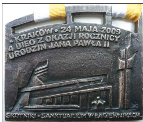
Medal czekający na wszystkich uczestników – zarówno biegu na 13,5 km, jak i marszobiegu

Impreza ma na celu uczczenie pamięci Papieża Jana Pawła II, popularyzację i upowszechnianie biegania jako najprostszej formy sportu i rekreacji ruchowej, propagowanie aktywnego i zdrowego stylu życia wśród mieszkańców Krakowa i całej Małopolski oraz integrację mieszkańców. Trasa głównego biegu (13,5 km) wiedzie ulicami Krakowa od boiska Pogoni Skotniki przy ul. Baczyńskiego do Sanktuarium Bożego Miłosierdzia i z powrotem. Odbędzie się także marszobiegu ulicami Skotnik na dystansie 2,5