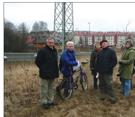
Radni na wizji przed zaopiniowaniem lokalizacji ZPGO w rejonie ulic Herberta i Do Sanktuarium Bożego Miłosierdzia