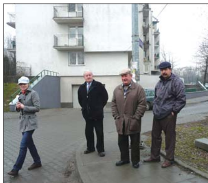
Przegląd ulicy Zbrojarzy

W każdym przypadku, kiedy Rada Dzielnicy IX opiniuje zamierzenie